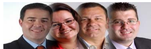
GRUPO MUNICIPAL SOCIALISTA

TODAS LAS PROPUESTAS DEL PSOE FUERON RECHAZADAS POR COALICIÓN CANARIA