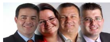
GRUPO MUNICIPAL SOCIALISTA

Con este punto de partida, desde el mes de Marzo de este año contamos con la Formación Juvenil "Juventudes Socialistas Guancheras". Esta agrupación nace como respuesta a una demanda de un grupo de jóvenes con nuevas ideas, deseos y ganas de trabajar para hacerle llegar a los gobernantes sus ideas y críticas, de como quieren que sea su pueblo.